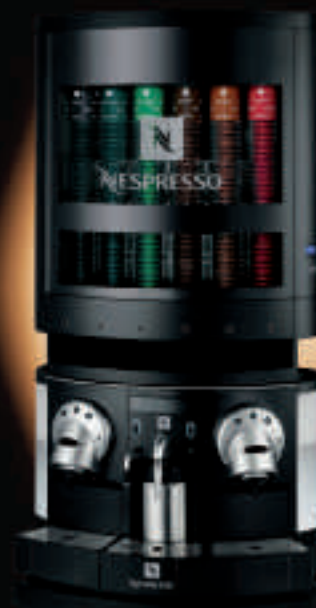
Расположение на кофе-машине